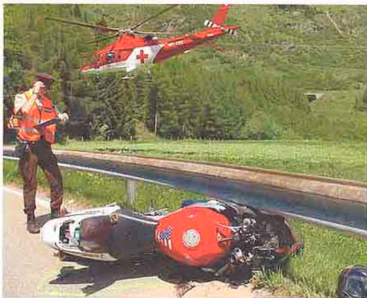
Tod am Strassenrand: Die Kritik an den neuen Töffregelungen steigt

befürchte «eine Zunahme schwerer und tödlicher Verletzungen». Auch die Unfallforschung der Winterthur-Versicherung hatte den erleichterten Einstieg für Autofahrer kritisiert: «Auto und Motorrad sind zwei verschiedene Paar Schuhe.» Doch beim federführenden Bundesamt für Strassen (Astra) ging man unbeirrt von «positiven Auswirkungen auf das Unfallgeschehen» aus.